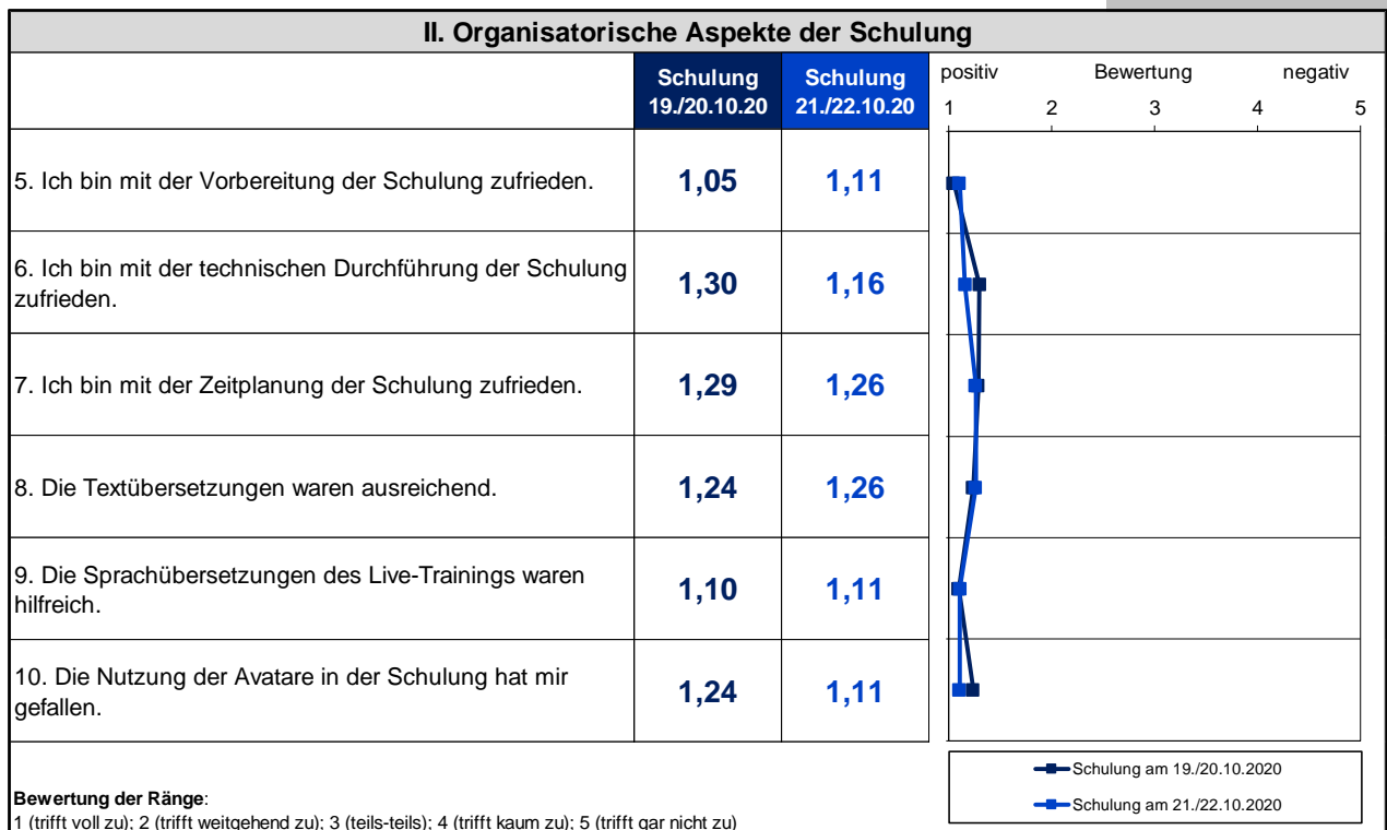
Abbildung 3. Vergleich der Bewertung der organisatorischen Aspekte der Schulung an den beiden Schulungsterminen